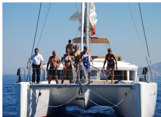
Catamarano Lagoon 40 **