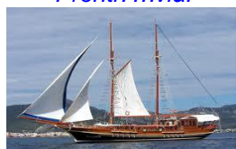
Caicco ottobre 2015